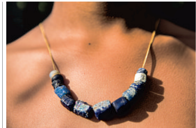
'Blue beads' zijn overblijfselen uit de slavertijd. Ze worden nog steeds opgedoken.