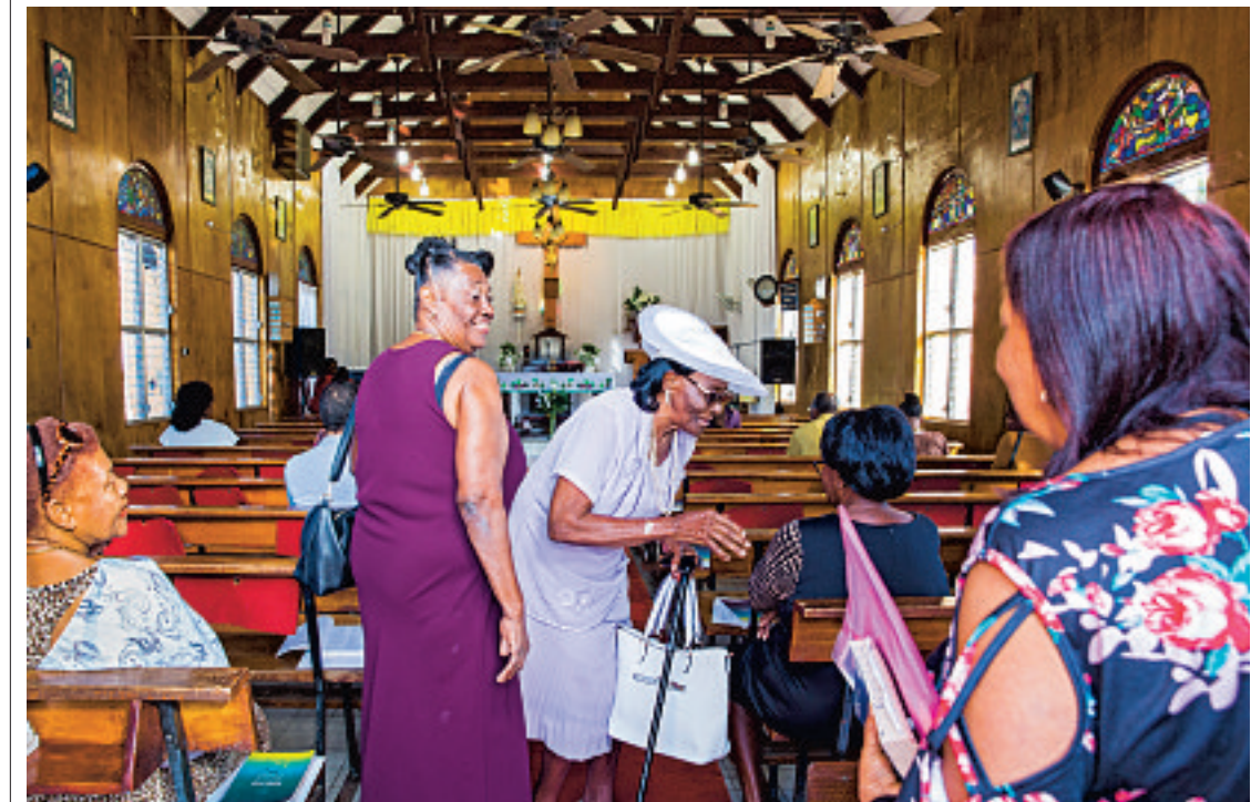
Driekwart van de bevolking op Statia is katholiek.

Sint Eustatius, het stiefkind van het Koninkrijk der Nederlanden.